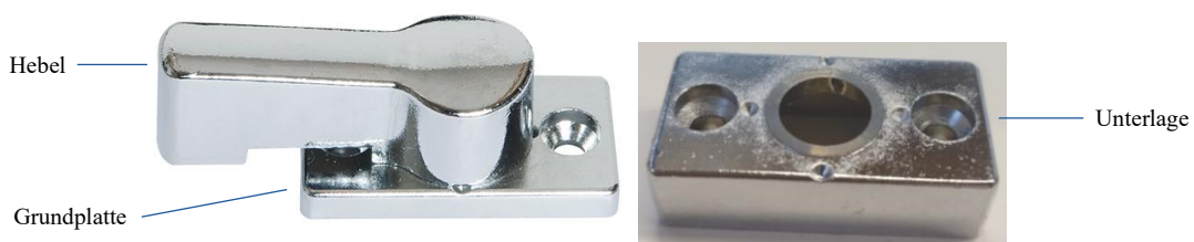
Abbildung 1: Vorreiber TÜRVERBINDUNGSRIEGEL 5100

Der Vorreiber TÜRVERBINDUNGSRIEGEL 5100 ist in verschiedenen Ausführungen erhältlich. Weiterhin ist eine Unterlage von 11 mm optional verfügbar zur Adaption weiterer Höhen. Der TÜRVERBINDUNGSRIEGEL 5100 ist in Chrom und Schwarz erhältlich.